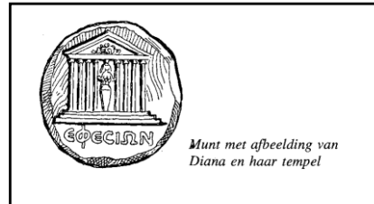
Munt met afbeelding van Diana en haar tempel

Deze brief is in de gevangenis geschreven door Paulus. Het is niet alleen een brief voor de gemeente in Efeze maar een rondzendbrief voor meer gemeenten in Klein-Azië. Efeze was een belangrijke handelsstad. De brief gaat over de rijkdom van Christus als Hoofd van de gemeente en de roeping van de leden om uit Hem te leven. Efeze was beroemd door de tempel van Diana of Artemis.