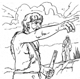
Toen hij op aarde was ging hij van plaats naar plaats, erop aandringend, dat de mensen zich zouden bekeren en laten dopen.

Je kunt Maleachi de laatste voorloper van de Heere Jezus noemen uit het Oude Testament. Weet jij wie de eerste voorloper uit het Nieuwe Testament is? Hoe werd hij ook wel genoemd?