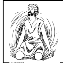
Jona's dankgebed --