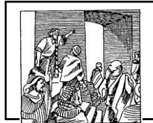
Jona gaat naar de stad Ninevé -- Jona 1:1-4

In deze vis was hij _____ dagen en _____ nachten.