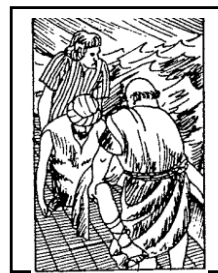
Jona wordt over boord gegooid --