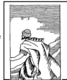
Jona vlucht --