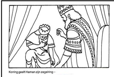
Koning geeft Haman zijn zegering –