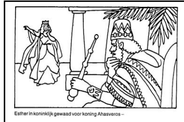
Esther in koninklijk gewaad voor koning Ahasveros –

Weet jij op welke dag van de twaalfde maand de joden gedood mochten worden? Zoek maar eens op in Esther 9. Haman wilde dat zo, maar de joden mochten zich dankzij Esther samen sterk maken tegenover hun vijanden. De joden gedenken nog steeds deze dag. Weet jij hoe ze dit feest noemen. Vul maar in, in het zwaard.