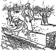
Met troffel en zwaard